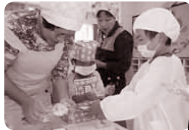
◀園児にクッキング指導する「ぐらちゃん」のメンバーたち