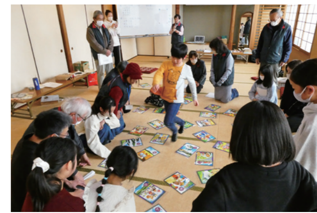
カルタをとおして郷土を学ぶ参加者

1月31日、町公民館において「竜王いろはカルタ大会」が開催され、小学1年生から6年生までの児童7人が参加しました。使用された「竜王いろはカルタ」は、町の名所・旧跡・歴史文化・伝統芸能、生活などが、生き生きと詠まれた読み札と、温かみのある絵札で構成された町オリジナルのカルタです。大会では、札が読み上げられると同時に、こどもたちが勢いよく手を伸ばして札を取り合い、会場には歓声と笑顔があふれていました。