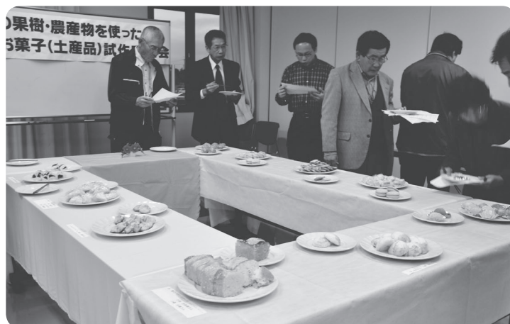
地元農産物を使ったお菓子（土産品）試作審査会

土産土法：地とれたものを漬物や干物にするなどの保存方法を考え、住んでいる環境に合わせた工夫をすること。また、旬のものを地ならではの料理法でもてなすこと。竜王町では、これをまちづくりに例え、まちにあるたくさんの資源（農産物、観光、歴史、自然など）を見直し、ひと工夫こらし、新しいものを生み出すことをめざしています。