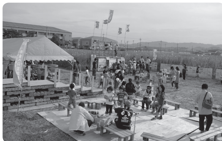
タウンセンター コスモスまつり