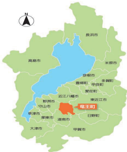
滋賀県竜王町位置図