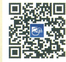
総合運動公園 ブログ