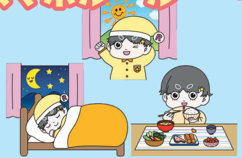
紙芝居キャラクター