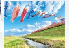
善光寺川の鯉渡し