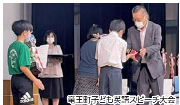
竜王町子ども英語スピーチ大会

男女共同参画など人権意識の高揚、ジェンダーフリーの推進、英語教育の推進、持続可能な地域コミュニティの検討など協働によるまちづくりをめざす事業に活用いたします。