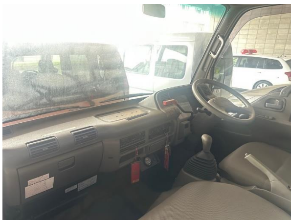
ダッシュボード周囲