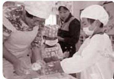
◀園児にクッキング指導する「ぐらちゃん」のメンバーたち