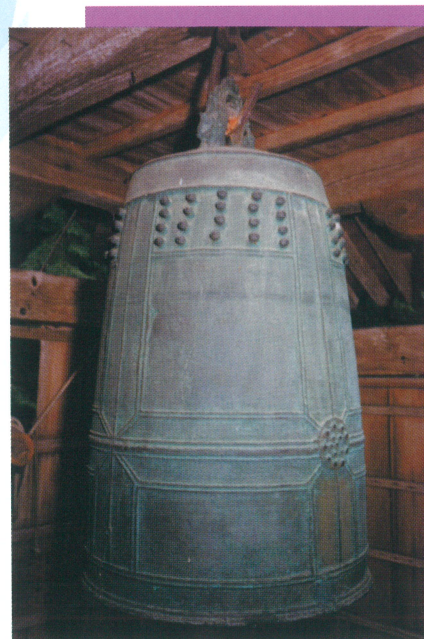
龍王寺の梵鐘（重要文化財）

開催場所 竜王町公民館 1階ホール (滋賀県蒲生郡竜王町大字小口 276 番地 1)